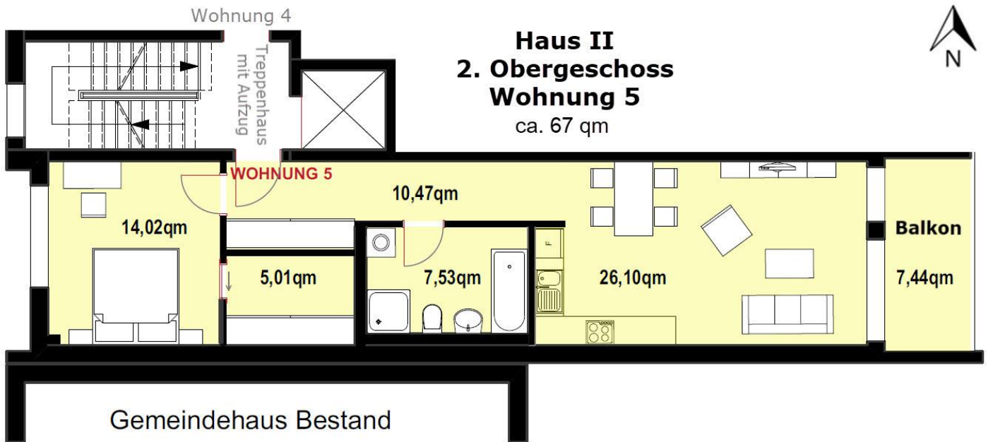
Die Lage der Wohnung im Haus: