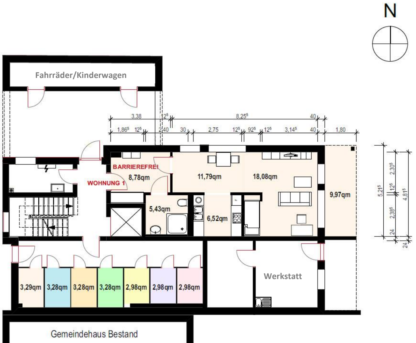
Die Abstell- und Gemeinschaftsräume im Erdgeschoss: